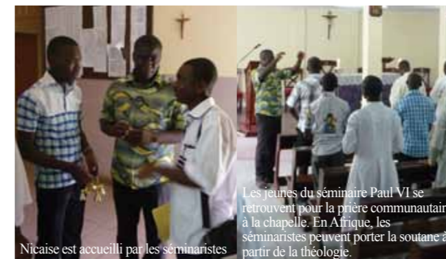
Les jeunes du séminaire Paul VI se retrouvent pour la prière communautaire à la chapelle. En Afrique, les séminaristes peuvent porter la soutane à partir de la théologie.